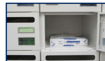
【メールボックス】 A4普通紙 約2,000枚程度 幅30cm×高さ22cm×奥行36cm