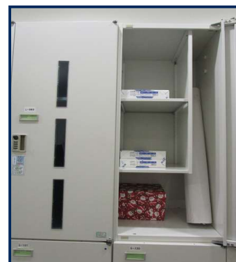
【団体ロッカー（大）】 幅45cm×高さ100cm×奥行41cm