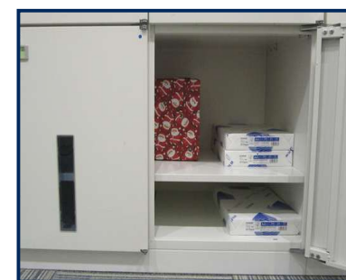
【団体ロッカー（小）】 幅45cm×高さ50cm×奥行41cm